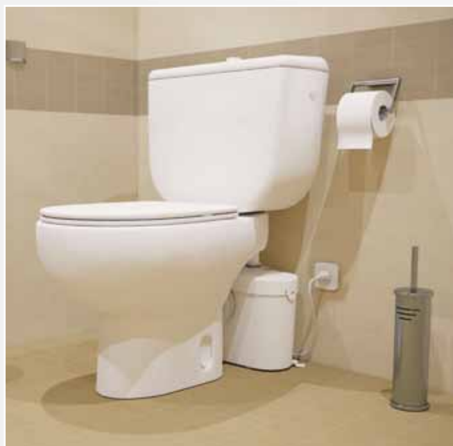
Refolements vertical et horizontal : ↑ 5 m → 100 m

Diamètre de refolement conseillé : 22 / 28 / 32 mm