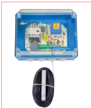
MICRO DSN BI-TENSION