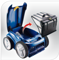
Bac filtrant hygiénique et facile à vider