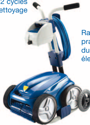
Rangement pratique du câble électrique