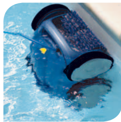
Brosses à rotations élevées