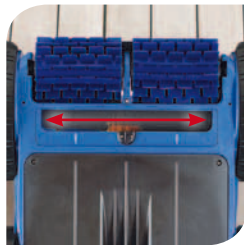
Bouche d'aspiration extra large pour aspirer tous types de débris