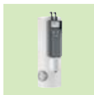
Inisol UNO 200 l à 400 l