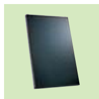
Capteur Inisol DB