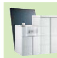
TWINEO EGC 17/29 ou 25 / B 200SSL