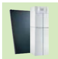
TWINEO EGC 17/29 ou 25 / V 200SSL