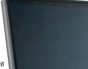
Capteur Inisol DB