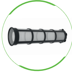
Cartouche filtrante pour les variantes pureliQ:K et KD

Enveloppe rigide Pour plus d'hygiène et de confort lors du remplacement de la cartouche filtrante.