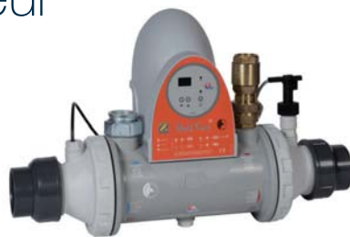
Heat Line sans circulateur