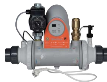
Heat Line Plus