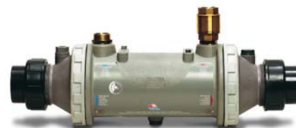
Heat Line nu